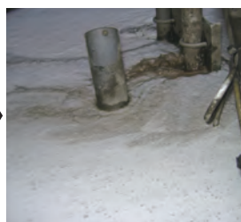
デスライム投入 1 時間後