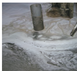
デスライム投入 0.5 時間後