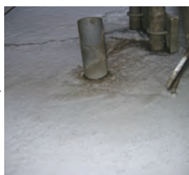
デスライム分解終了