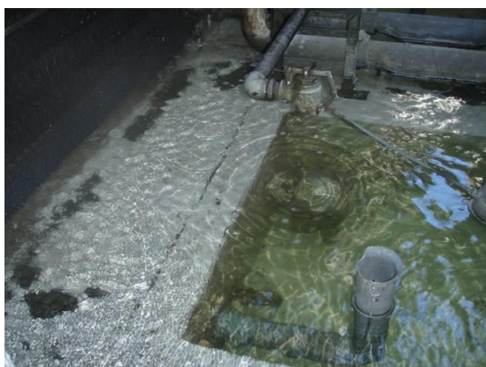
レジオアタックLA投入前