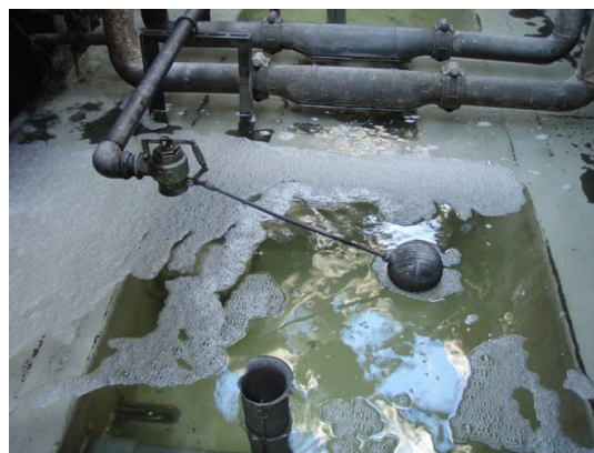
水管洗浄中の状況