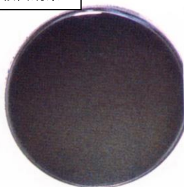
殺菌処理水 レジオアタックLA処理後